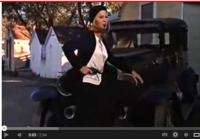
Bonnie and Clyde (1967) - Official Trailer