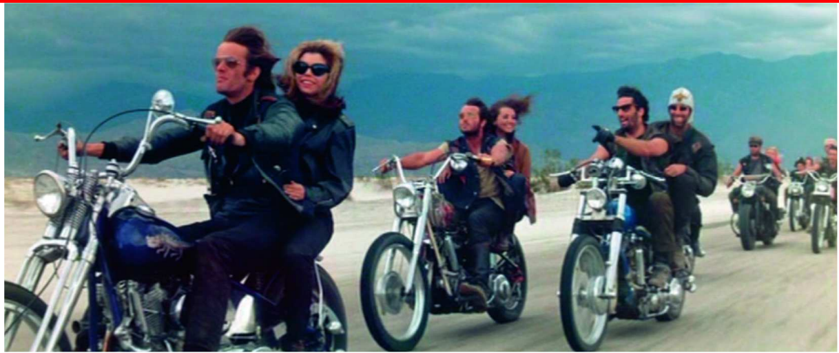
Szene aus dem Film Die wilden Engel (s.o.). Motorrad links vorne: hinter Peter Fonda sitzt Nancy Sinatra.