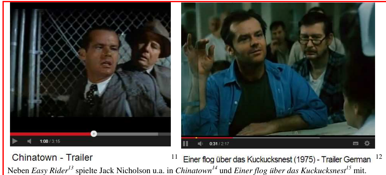
Chinatown - Trailer

war. Zu diesem Zeitpunkt war June seit mehr als einem Jahrzehnt tot – sie wurde nur 44 Jahre alt ... (siehe weiter in Wikipedia 10 )