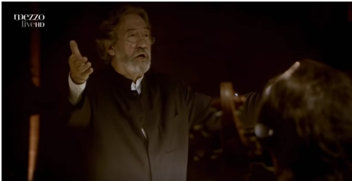
Bach: Mass in B minor, BWV 232 | Jordi Savall 15

Ein weiteres "Schlüsselerlebnis" (SE-155) in der Ausnahmemusik Johann Sebastian Bachs ist: Dona nobis pacem (BWV 232, H-moll-Messe , 24., Arie Chor [1:42:32-1:45:00])